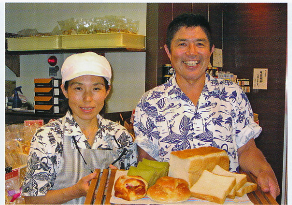
▲おいしいパンの秘密は、小麦をベースに玄米を加えて作った天然酵母です。この天然酵母が味を良くします。

□フルーツ酒特区に関するお問合せ 市役所農政課（TEL 34-6640）へお尋ねください。