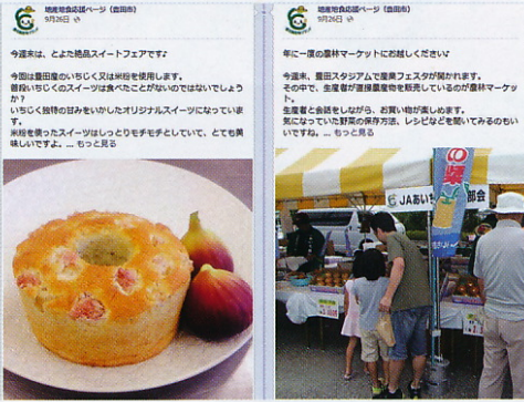
▲平成25年9月26日に紹介されたフェイスブックページの事例です。

市役所農政課ホームページから、「地産地食応援フェイスブック」おもしろいとよまを召し上がれ」にリンクが貼られています。ぜひ、一度訪れてご覧ください。